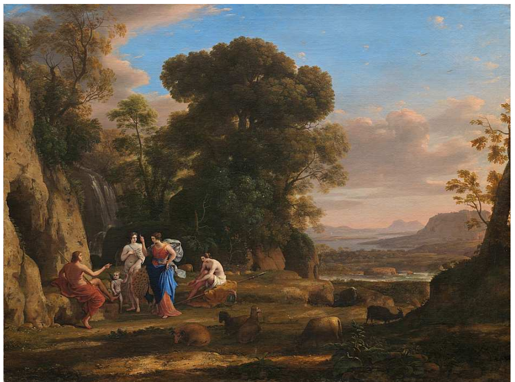
« Le jugement de Paris » par Claude LORRAIN / 1646