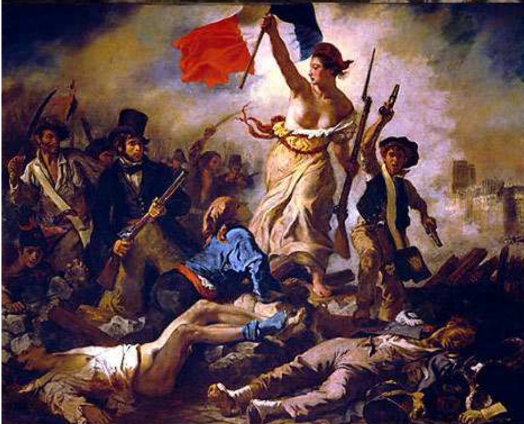
Eugène DELACROIX « La Liberté guidant le peuple » 1830