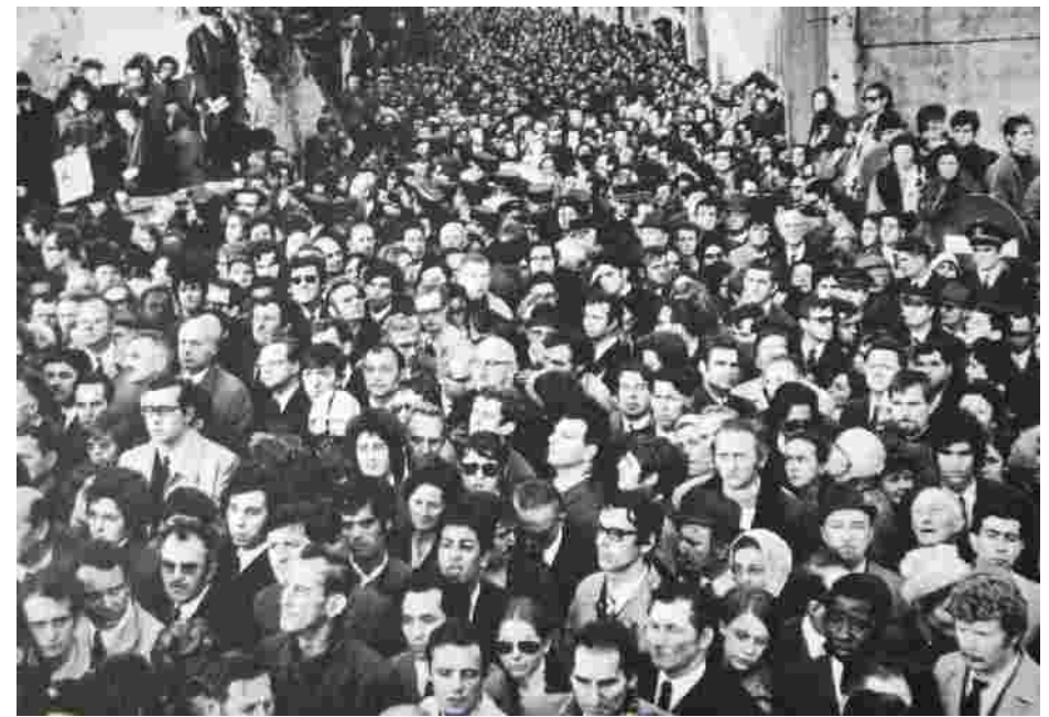
Funérailles de Charles de Gaulle