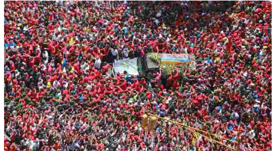
Funérailles de H CHAVEZ au VENEZUELA