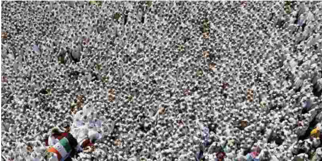
Funérailles d'un dignitaire en INDE