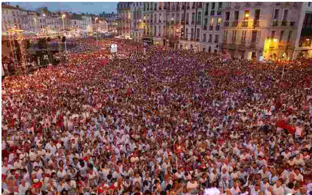
Fêtes de BAYONNE