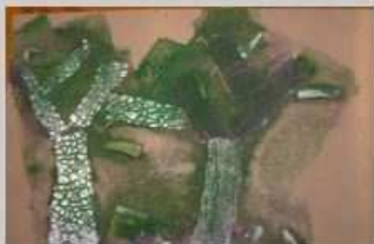
Des fragments de tapisseries (à reliefs) / collés sur une plaque rigide. La peinture est passée au rouleau.