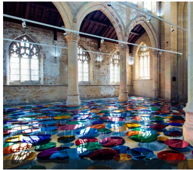
Liz WEST (lieux)

Ils investissent parfois des lieux sacrés, ou réalisent des œuvres sur la notion même de Sacré.