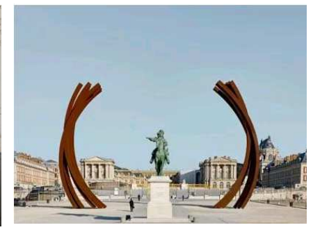
Bernar VENET (environnement)

L'occasion de travailler sur les mots et les expressions :