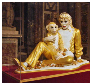
Jeff KOONS (personne/animal)