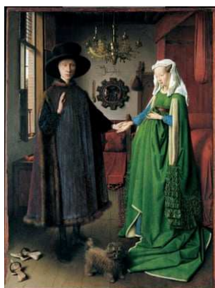
« Les Époux Arnolfini » peinture sur bois du peintre Jan van Eyck, 1434