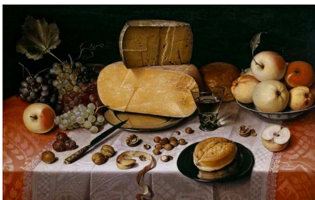
« Nature morte avec trois fromages »