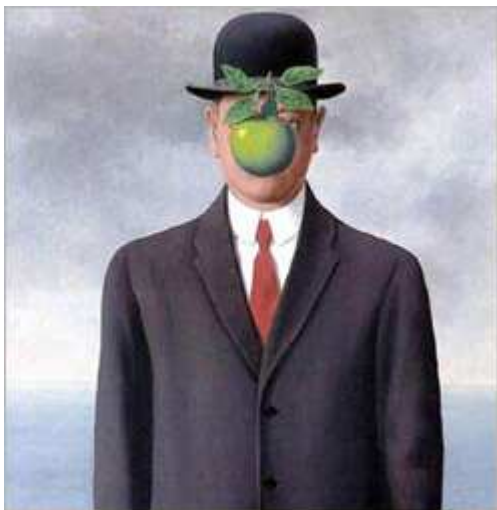
« Le fils de l'homme » par René Magritte en 1964 .