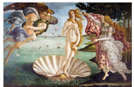
« La Naissance de Vénus » de Sandro Botticelli, 1484-1485