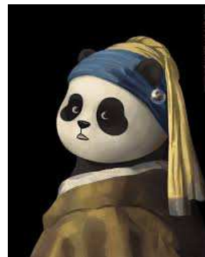
« La jeune fille à la perle » par Johannes Vermeer en 1665

Ci-dessous, l'artiste chinois ALONG , transforme des œuvres peintes, classiques et célèbres, en intégrant un symbole chinois que tu reconnais ! Cela les rend plus « rigolotes » et contemporaines (d'aujourd'hui).