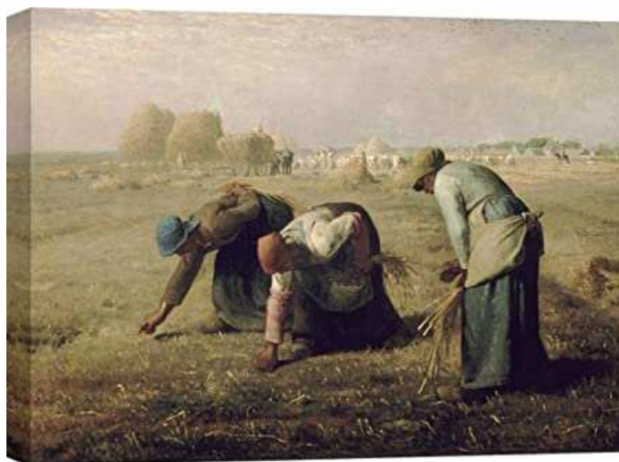
« Des glaneuses » Jean-François Millet, peint en 1857 .