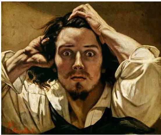
« Le Désespéré » tableau du peintre français Gustave Courbet réalisé entre 1843 et 1845

Choisis une œuvre célèbre et transforme-la.