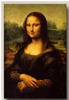
« La Joconde » de Léonard de Vinci, réalisé entre 1503 et 1506 ou entre 1513 et 1516