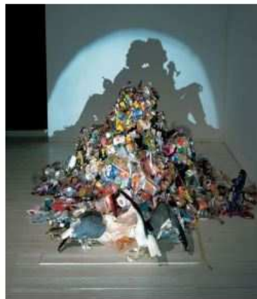
Sue Webster & Tim Noble