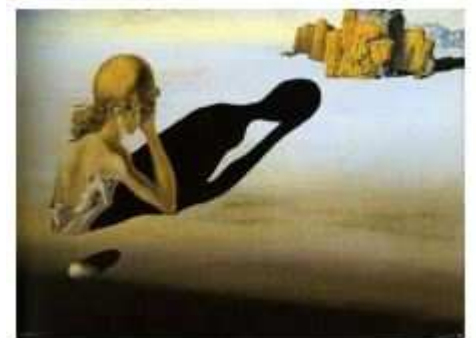
DALI « Sphinx »